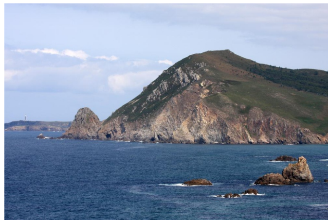
Monte da Vela e Pena Branca