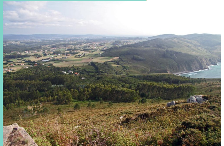
Vista cara ao interior