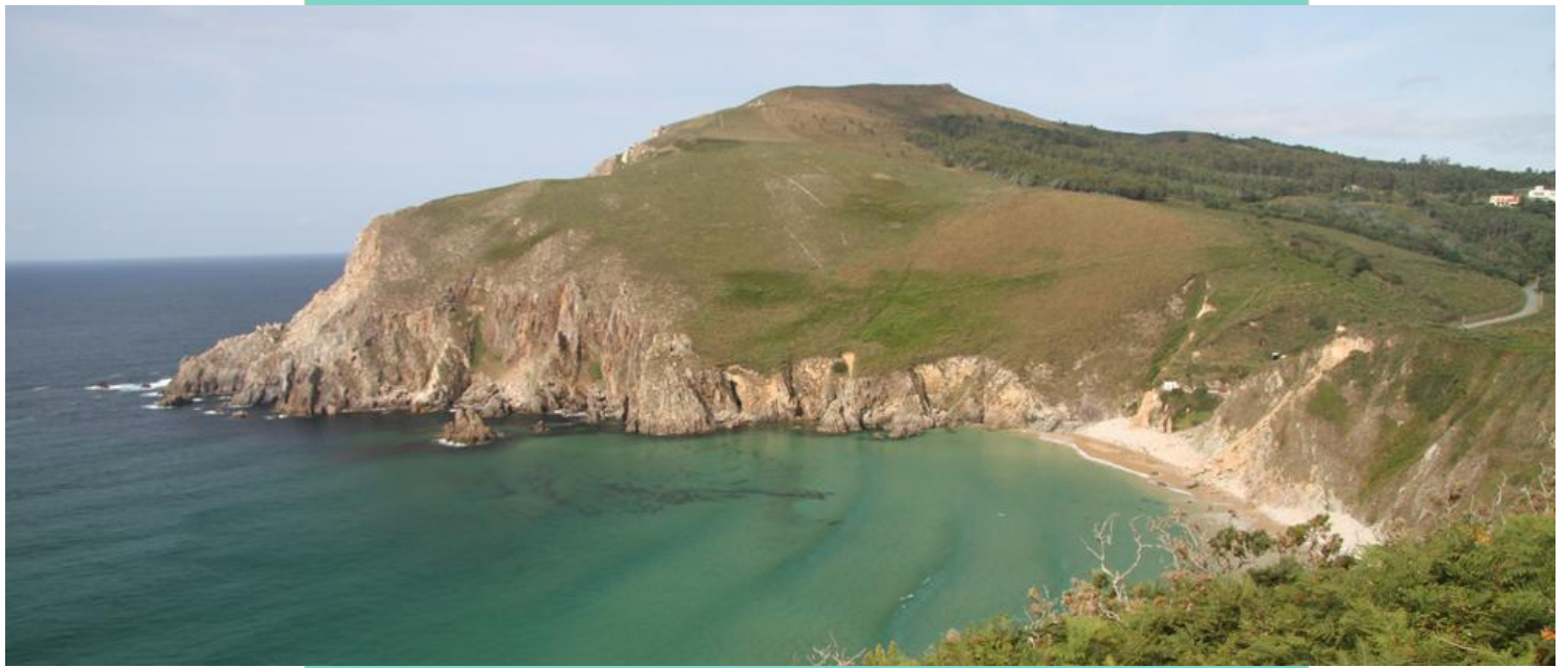
Vista do Monte da Vela e a praia de Campelo