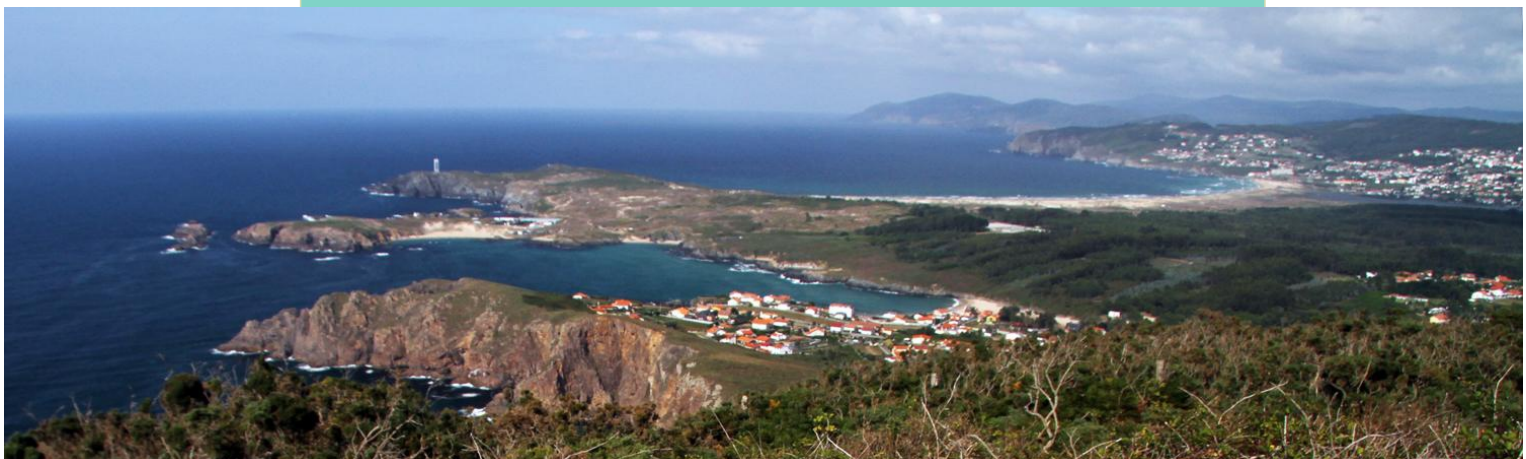
Vista da costa de Valdoviño desde o alto do Campelo