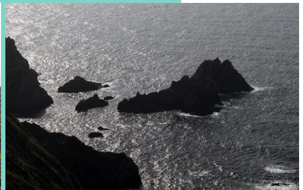
Punta Fontes e illote do Castelo