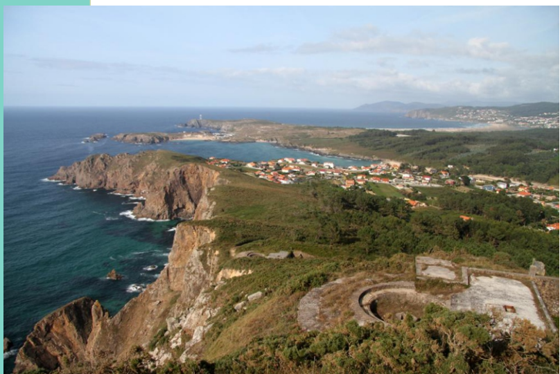
Alto de Campelo: vista sobre a costa de Valdoviño. No primeiro plano os restos das baterías militares.

De ahí en diante os toxos, que medran en liberdade, a maiores de produciren un son pouco agradable poden deixar máis dun sinal na pintura. Pero para camiñar a pé non hai problema porque o camiño, con bo firme, conserva amplitude suficiente para o paso de persoas ou bicicletas, a subida ao cume é un pouco máis estreita e menos regular, pero andase con facilidade