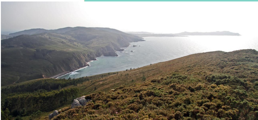
Vista da costa de Valdoviño, Narón e Ferrol